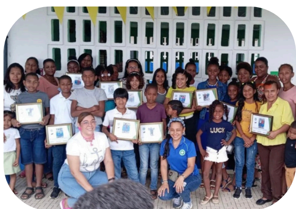
Comunidad de Puerto Escondido

Este programa fue auspiciado por @conapred_pa.