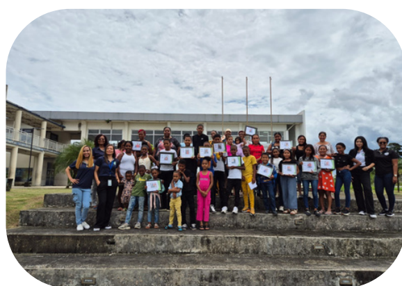
Comunidad Altos de Los Lagos